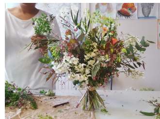
Confection d'un bouquet