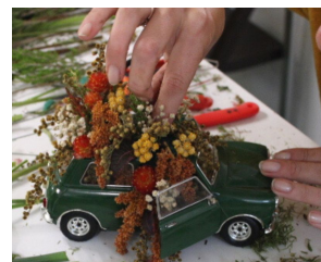
Composition originale dans un contenant détourné