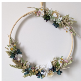
Couronne murale en fleurs séchées