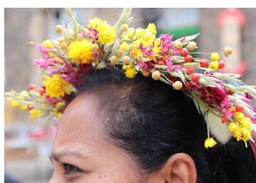
Se mettre en scène avec des couronne de tête en fleurs séchées