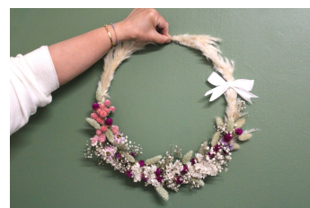
Couronne en fleurs séchées