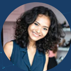
VENDEURS / VENDEUSES